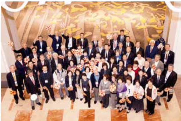
日本の現ガバナー夫妻集合