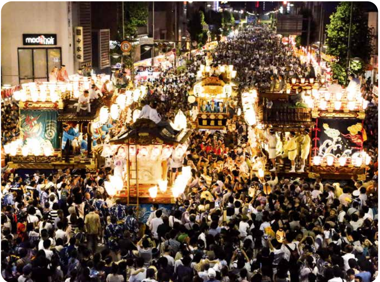
八坂神社祇園大祭「熊谷うちわ祭」 7月 20 日～ 22 日