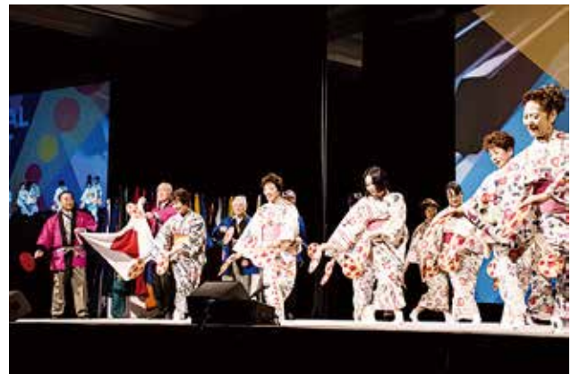
国際親善ナイトで踊る日本チーム