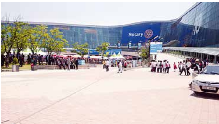
会議場外観：韓国国際展示場キンテックス

研修はAM:9:00～17:00まで、かなりハードなスケジュールですが本年度は他地区の研修も取り入れて開催致しますので多くの会員の方の受講をお待ちしております。