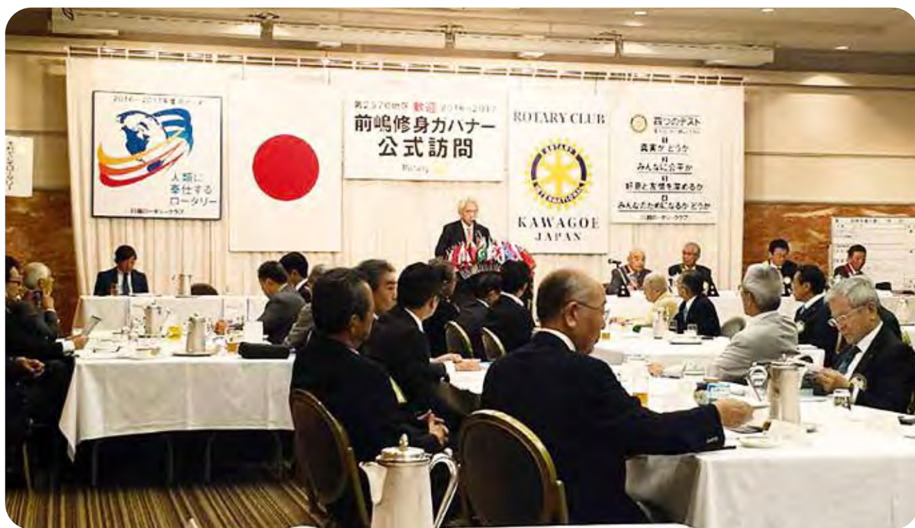
ガバナー公式訪問初日（川越ロータリークラブ）