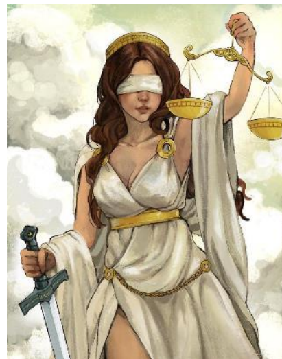
真実の女神テミス