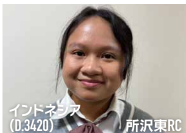
インドネシア(D.3420) 所沢東RC