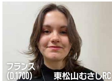
フランス(D.1700) 東松山むさしRC