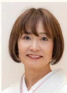
ガバナーエレクト