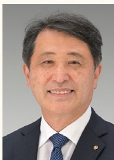
地区ラーニングファシリテーター

結びに、皆様のますますのご健勝と、地区内各クラブのさらなるご発展、ご多幸を心よりご祈念申し上げまして、ご挨拶とさせていただきます。