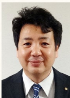
ガバナーノミニー

ガバナーエレクトとして、多くのことを学びながら、皆様のお力添えをいただき、次年度に向けた準備を進めてまいります。どうぞご指導、ご協力を賜りますようお願い申し上げます。